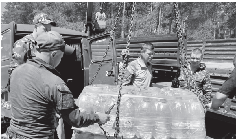
Вода на фронте снимает усталость, даёт силы, поднимает дух бойцов

«19 июля 2023 года, учитывая экстремальные погодные условия, сложные условия рассредоточения войск и риски добычи питьевой воды на территориях соприкосновения и в приграничных зонах, высокую потребность личного состава боевых подразделений СВО в обеспечении питьевой водой, я дал поручение организовать бесперебойную регулярную поставку бутилированной питьевой воды для военнослужащих. Изначально ставили себе задачу направить бойцам гуманитарные акваконвои из 50 — 60 тонн, потом из 200. Но знойное лето, горячие боевые действия, многочисленные просьбы и обращения армейских подразделений, где служат орловские ребята, а также множества других, дислоцированных в зонах указанных выше направлений, дали нам понимание всей серьёзности и стратегической важности нашего, казалось бы, бытового «водного» груза. Орловские гуманитарные конвои с питьевой водой стали легендарными не только по регулярности, организованности доставки, выгрузки и учёта потребности всех снабжаемых боевых формирований, но и по высокому патриотическому настрою, солидарности фронта и тыла, человеческого и земляческого единства, крепкой дружбы, взаимопомощи и поддержки Орловщины и рос-