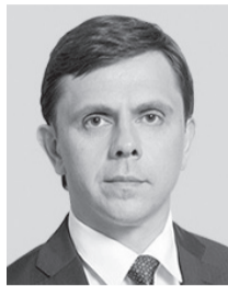
Андрей Клычков, губернатор Орловской области:

Несмотря на беспрецедентные санкции, экономика Орловщины развивается стабильно, выполняются все социальные обязательства региона перед гражданами