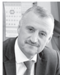
Владимир Ивановский, первый заместитель губернатора Орловской области в правительстве Орловской области:

Не меньшие планы определены и на 2023 год. Надеемся, что он, при всех объективных сложностях, станет для экономики области не менее плодотворным.