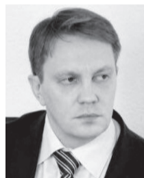
Вадим Тарасов, заместитель губернатора Орловской области по планированию, экономике и финансам:

Развитие системы здравоохранения остаётся нашей приоритетной задачей. В текущем году планируем отремонтировать 21 лечебное учреждение. В ближайшее время в медицинские учреждения Орловской области поступит более 40 единиц нового медицинского оборудования. В 2023 году начнётся строительство двух новых школ на 1225 мест каждая — в Северном районе города Орла и в Болховском микрорайоне Орловского округа.