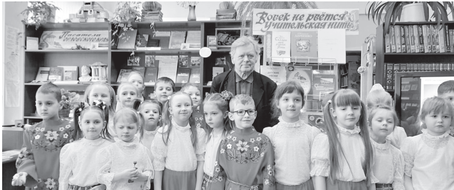
Композитор в окружении юных исполнителей его песен