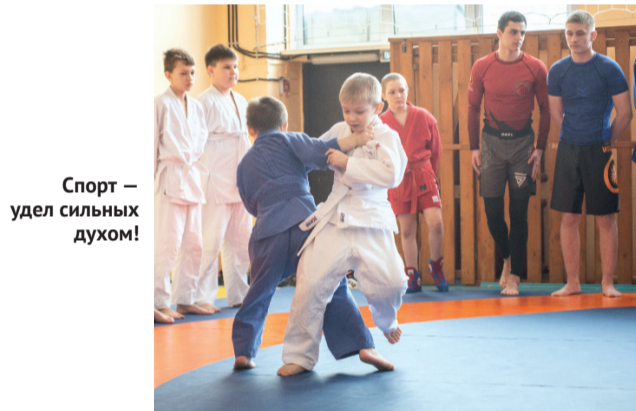
Спорт — удел сильных духом!