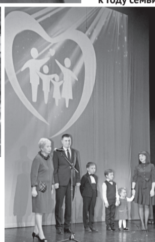
От Года педагога и наставника — к Году семьи

— Уходящий год был так объявлен не случайно — ведь именно мы, учителя, воспитываем будущее поколение нашей страны. Профессия учителя такова,