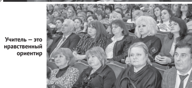
Учитель — это нравственный ориентир

Орловской области введены гранты работникам образовательных организаций, достигшим высокого уровня подготовки школьников и студентов по результатам ЕГЭ, олимпиад, национальных чемпионатов «Молодые профессионалы» и «Абилимпикс».