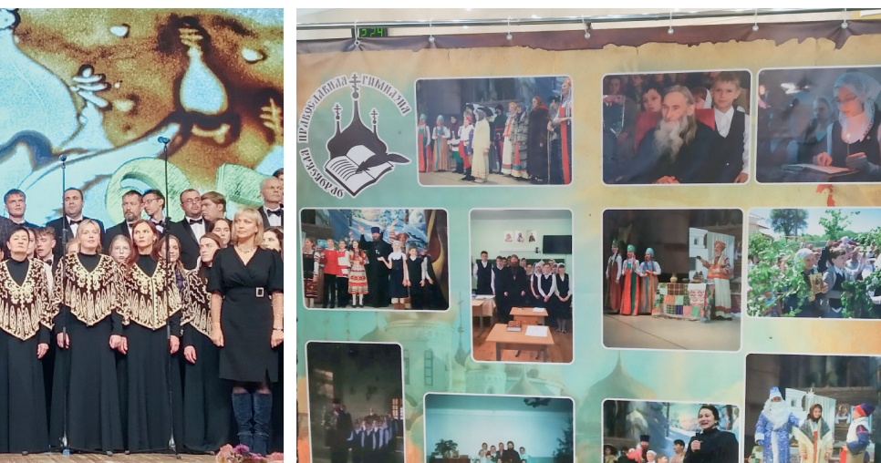
Фотовыставка, посвящённая 25-летию гимназии

— Этот юбилей важен не только для вашего учебного заведения, но и для Орловской митрополии и всей нашей области, — сказал он. — Тогда, четверть века назад, было принято принципиальное решение, ставшее важным вкладом в укрепление позиций православия на Орловщине, в сохранение наших исконных ценностей, возвращение к истокам российской системы образования в русле благотворных