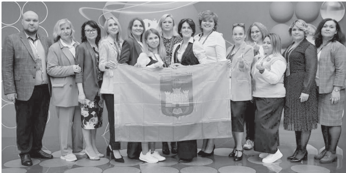
Делегация Орловской области на форуме классных руководителей

«Конструктор будущего». На данный момент цифры таковы: профориентационные уроки за сентябрь посмотрели более 55 млн. раз, уникальными посетителями стали 4 млн. человек, 1,5 млн. школьников прошли профориентационную диагностику.