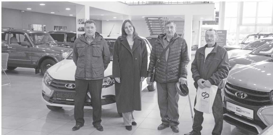
Получателям новых автомобилей пожелали лёгкой дороги!

Трое пострадавших на производстве получили ключи от новых автомобилей «Лада-Гранта».