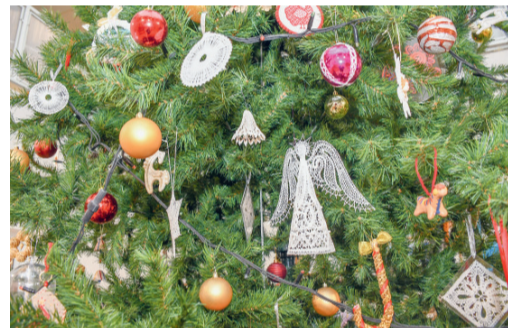
Каждая игрушка на ёлке сделана в традиции ремёсел Орловской области