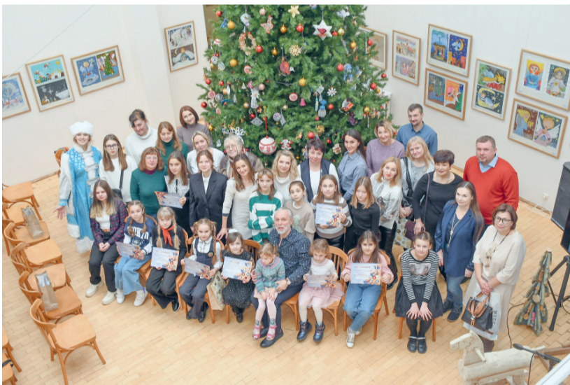
Ёлка, творчество и праздник

Также были подведены итоги и вручены памятные серти-