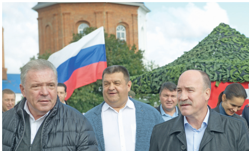
Поздравить участников фестиваля приехали почётные гости

— Мы представляем Духовно-православный центр «Вятский