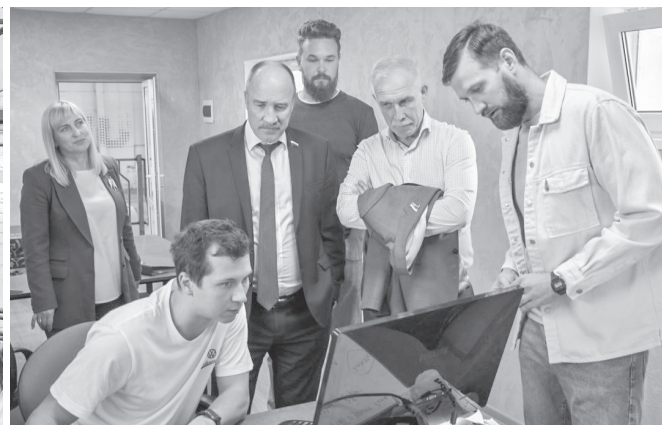
Продукцией орловской фирмы заинтересовались крупные инвесторы

Далее делегация отправилась на одно из орловских