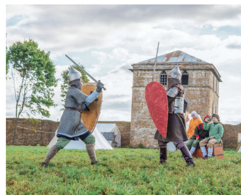
Исторические реконструкторы представили разные эпохи становления Руси

— Этот благотворительный фестиваль проводится по благословению Святейшего Патриарха Московского и всея Руси Кирилла, его духовника схиархимандрита Илия, а также высокопреосвящённого митрополита Орловского и Болховского Тихона, — напомнил председатель Орловского областного Совета народных депутатов Леонид Музалевский. — Благодаря батюшке Илию фестиваль несёт особую миссию — сохранение уникального исторического наследия России, памятника архитектуры федерального значения «Сабуровская крепость». Долгие годы она находилась в забвении, но благодаря батюшке Илию и Духовно-православному центру «Вятский Посад» вот уже второй год продлится её возрождение, сохранение духовного и культурного наследия страны. Таким обра-