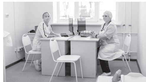
В Ливнах открылась долгожданная детская поликлиника

В настоящее время работы на семи из 18 объектов завершены, среди