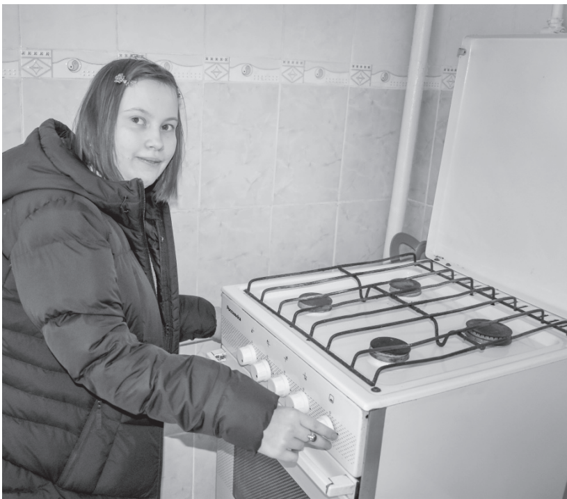
Первым делом включим газовую плиту

«Прежде чем заселить в жилое помещение инвалида-колясочника, оборудуем пандусы в подъезде, подгоняем на нужную высоту замки, выключатели, розетки и всё другое, чтобы жилец не испытывал неудобства.»