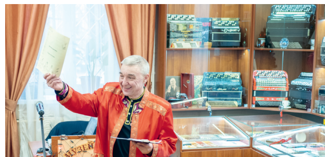
Музей русской гармоники в Орле Стр. 8