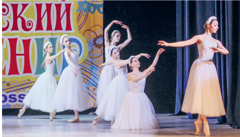
Орловский «Ренессанс» — триумфатор международного конкурса-фестиваля хореографического искусства

По словам Ольги Ошеровой, каждый номер «Ренессанса» может соперничать с работами балетмейстеров других городов. Особая гордость ансамбля — постановка фрагмента по мотивам балета выдающегося хореографа XIX века Жюлье Пер-