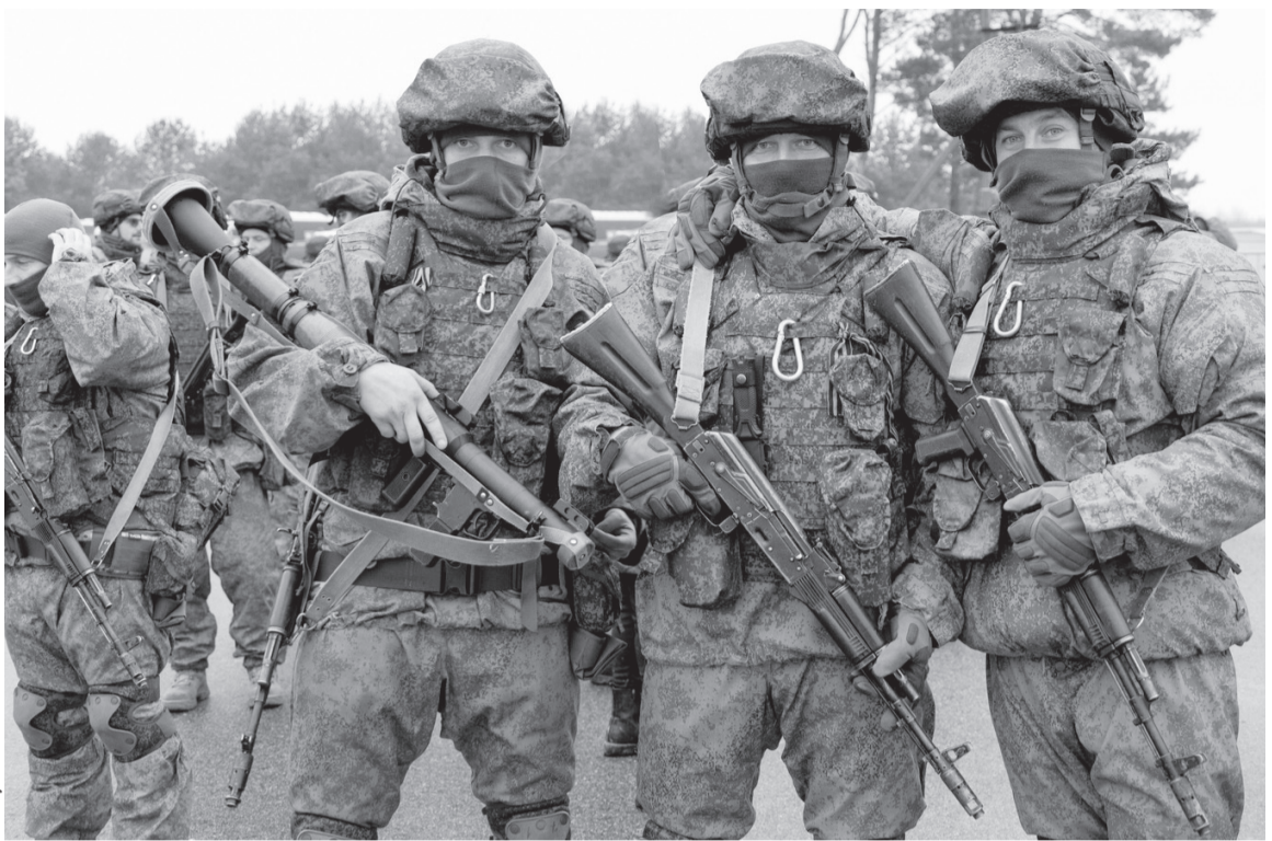
Уже приостановлено более 5,5 тыс. исполнительных производств в отношении участников СВО

— Эта мера реализована в целях защиты должников с небольшими доходами, при этом нужно соблюсти ряд условий. Должник должен иметь постоянный доход — зарплату, пенсию, пособие или другие доходы. Льгота предоставляется не автоматически, а только