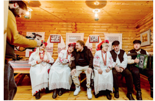
Участников проекта принимали на Орловской земле как родных