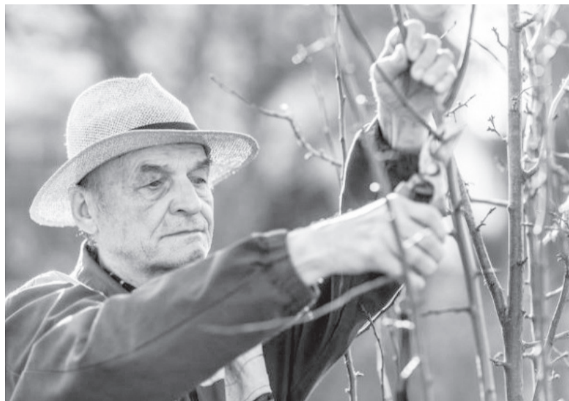
Для нарезки черенков берут только однолетние, хорошо созревшие побеги с южной стороны кроны

Сделать его достаточно просто. Уплотняем снег, за-