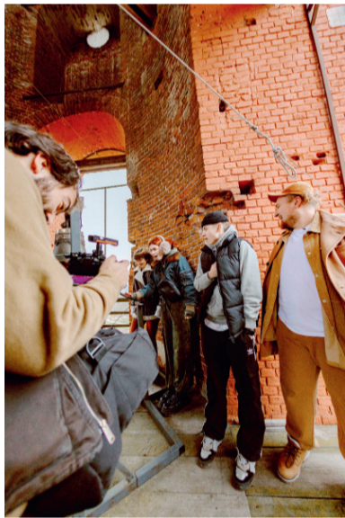
В старинном Болхове

На Орловщине участники проекта провели всего несколько дней, но за это время успели побывать в Новосиле, Болхове, Ливнах, Спасском-Лутовинове и, конечно же, в Орле. Они познакомились с местными традициями и культурой, национальной кухней, фольклором, полюбовались самыми красивыми местами нашего края.