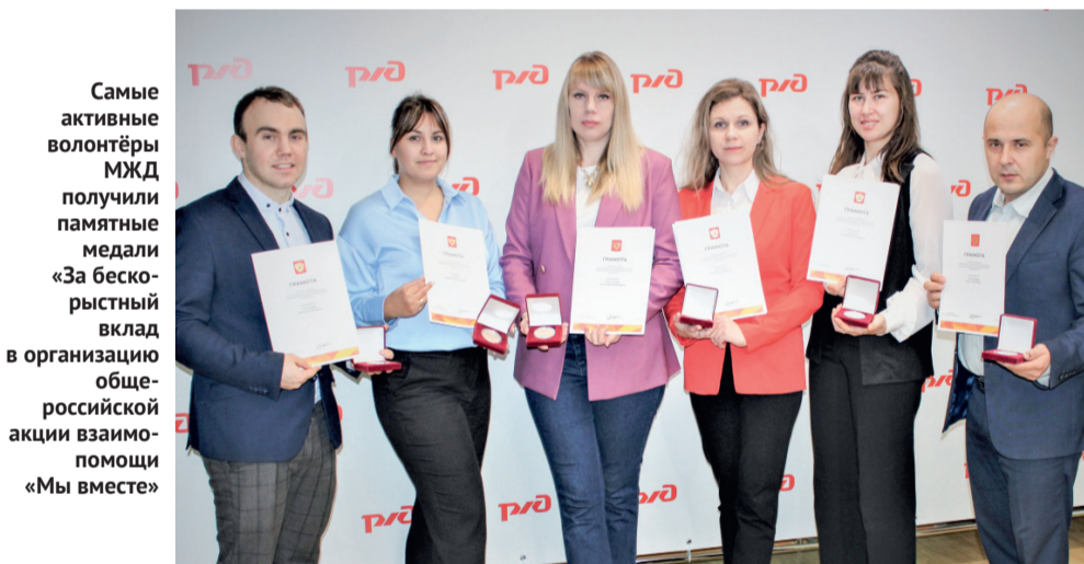
Самые активные волонтеры МЖД получили памятные медали «За бескорыстный вклад в организацию общероссийской акции взаимопомощи «Мы вместе»