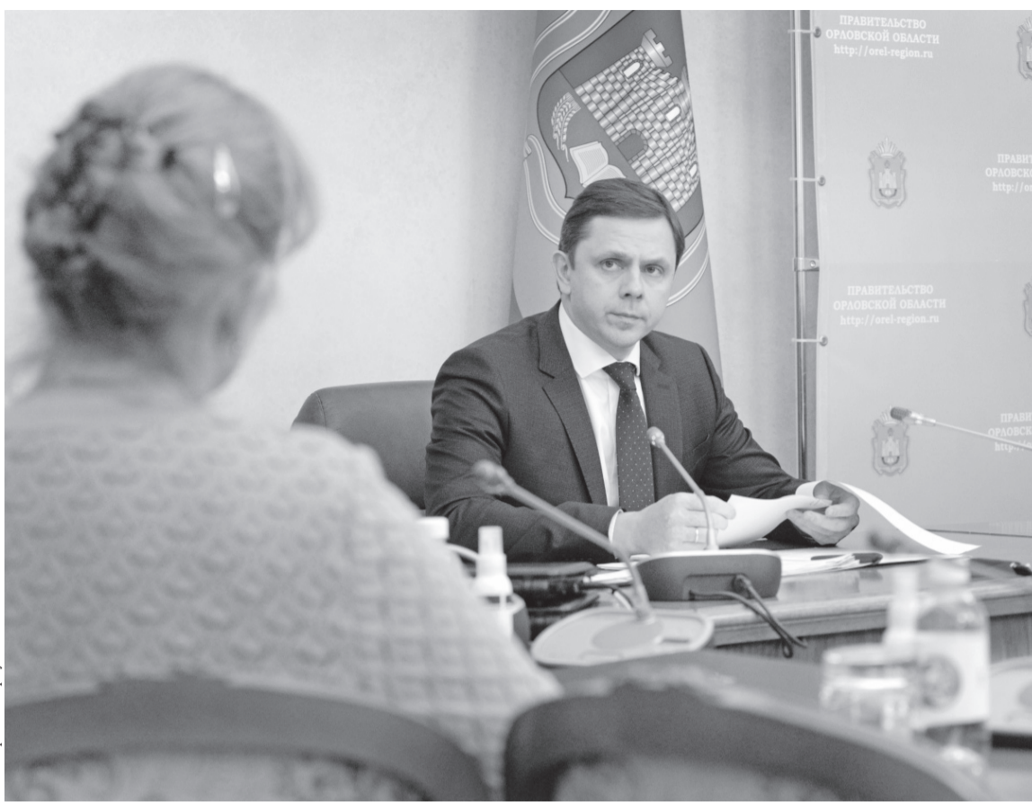
Даже на трудные вопросы, приходящие на приём к губернатору, люди получают ответы.