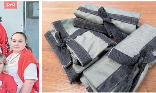
На форуме волонтеров РЖД в Москве