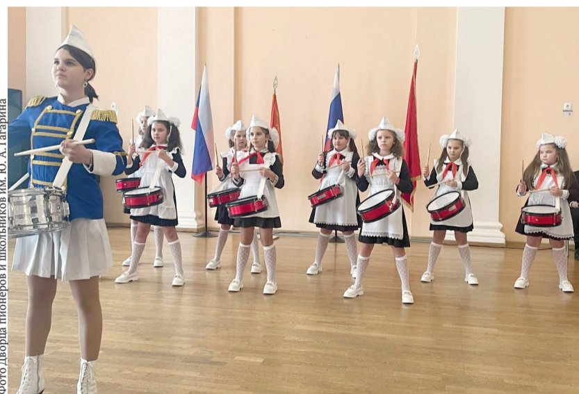
Фото Дворца пионеров и школьников им. Ю. А. Гагарина