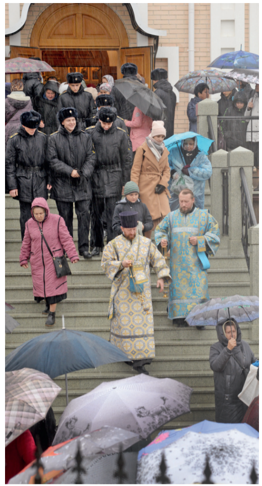
Казанский храм на Наугорском шоссе — начало пути