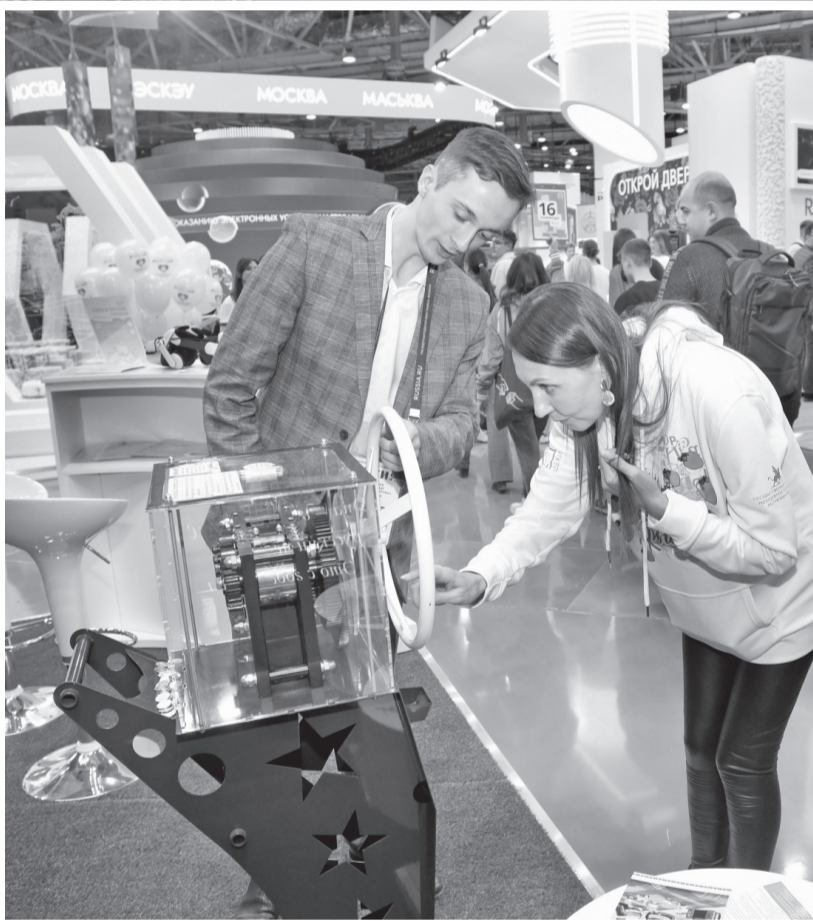
Гости орловской экспозиции могут самостоятельно отчеканить сувенирную монету