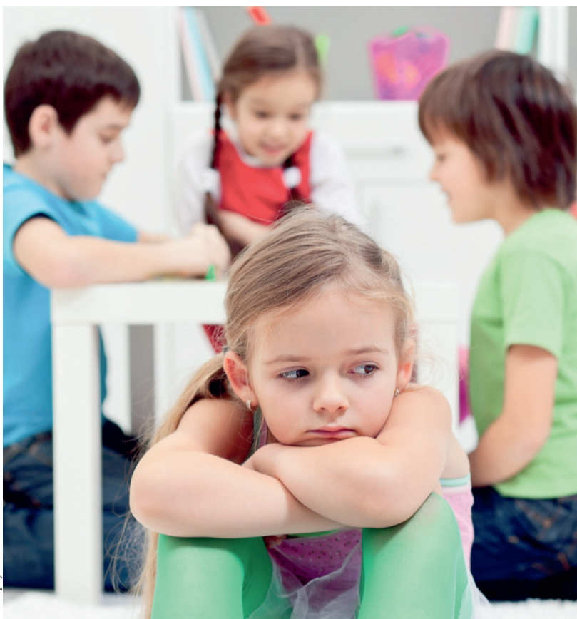
Основы здоровой психики закладываются с детства

— Это естественный процесс. Образно говоря, те «ячейки памяти», которые заполняются в молодости, более стойкие, нежели те, которые работают в старости. Поэтому пожилые люди хорошо помнят о том, что было десятилетия назад, и быстро за-