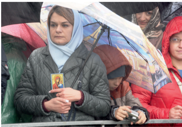
Крестный ход — возможность ощутить единение