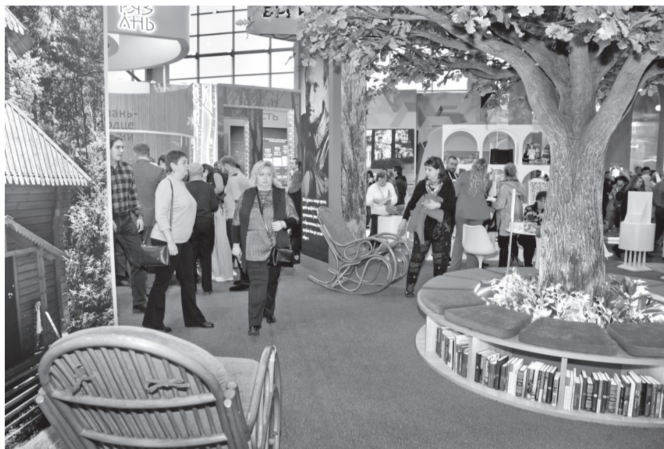
В центре орловской экспозиции — знаменитый Тургеневский дуб, под кроной которого можно отдохнуть

Зонирование орловского павильона построено по трём ключевым темам: «Литературная столица России», «Православ-