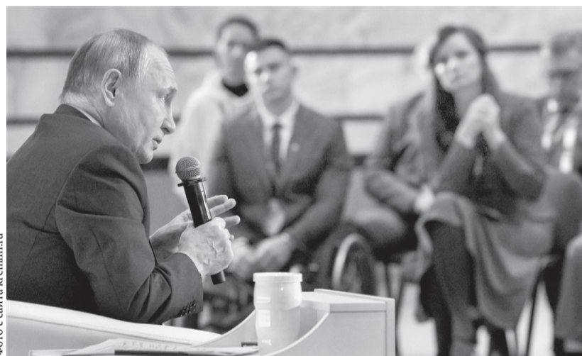
Владимир Путин: — Россия встала на защиту русских людей, проживающих в Крыму, Донбассе, Новороссии

Накануне Дня народного единства в Музее Победы в Москве Президент России Владимир Путин провёл встречу с членами Общественной палаты Российской Федерации нового состава и председателями общественных палат субъектов РФ.