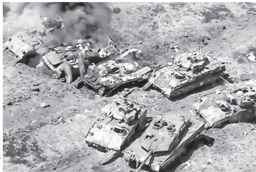
Превращённая Вооружёнными силами России в металлолом хваленая западная бронетехника — это явно не та «картина маслом», которую Пентагон ждёт от украинского «контрнаступа»

А результат этот кураторами из Вашингтонского об-