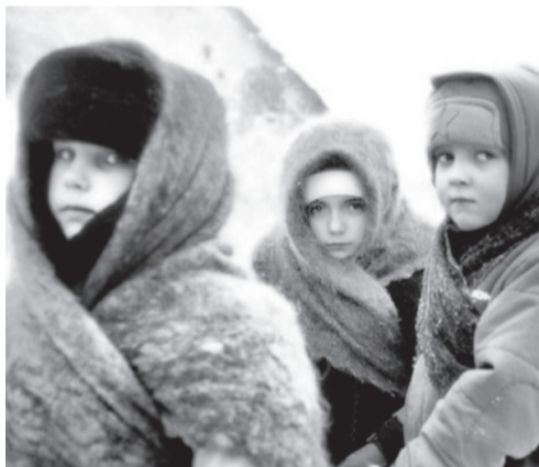
Война лишила их детства