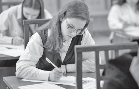
Сдавать ЕГЭ-2024 будут почти 2700 выпускников средних школ области

Участие в этой акции, инициированной Росособрнадзором, даёт родителям уникальную возможность на практике познакомиться с правилами, процедурой и заданиями ЕГЭ, чтобы снять излишнее психологическое напряжение перед экзаменами.