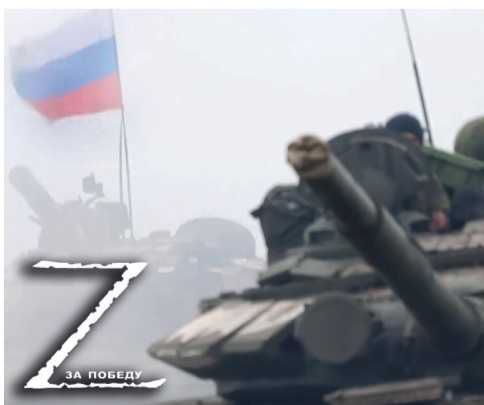
Специальная военная операция