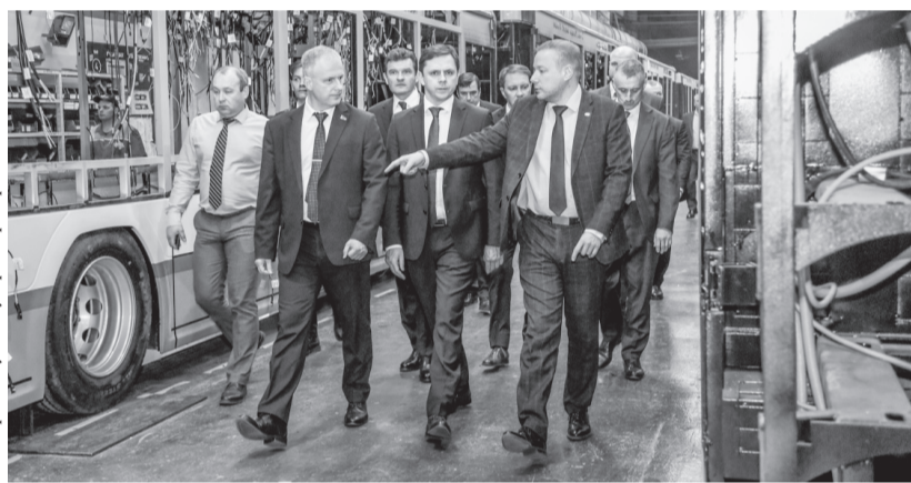
На заводе «Белкоммунмаш»