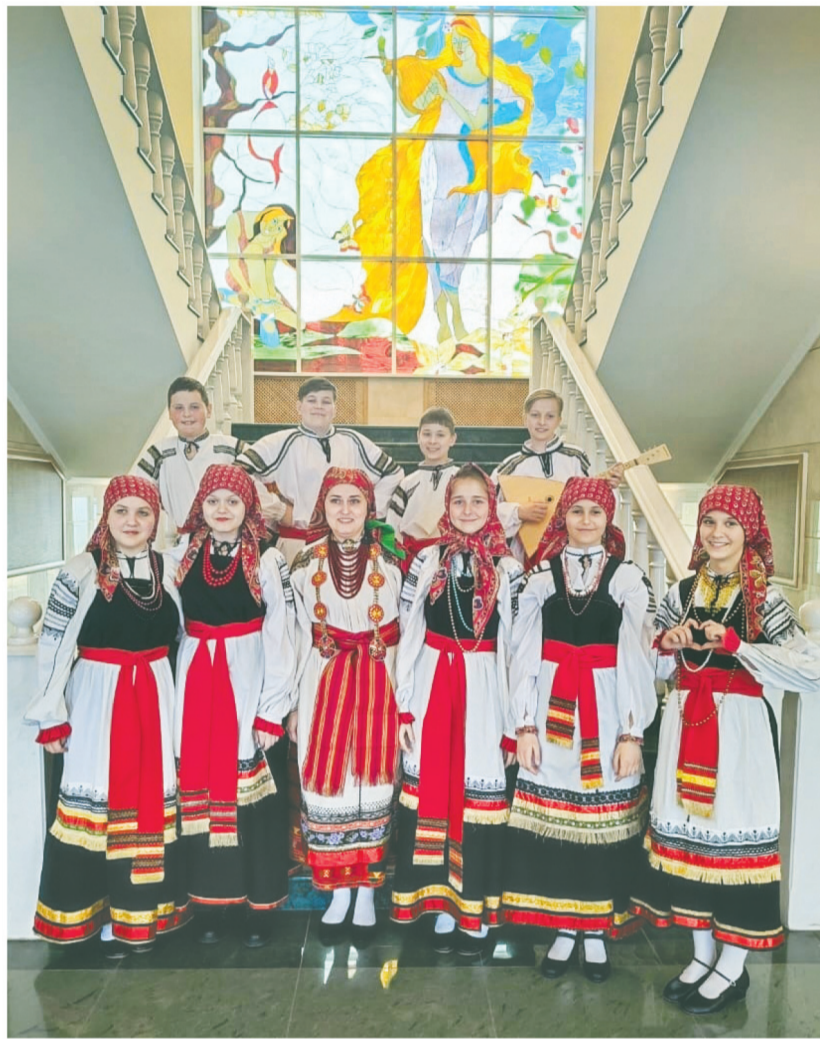
Обладатель Гран-при — фольклорный ансамбль «Вёснущка»