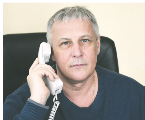
В лабиринтах уха, горла, носа

Потеря обоняния после перенесённого ковида — серьёзная проблема, но чаще всего это обратимый процесс