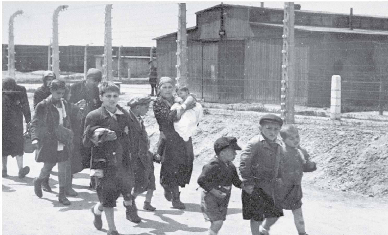
Маленькие дети на войне быстро взрослели