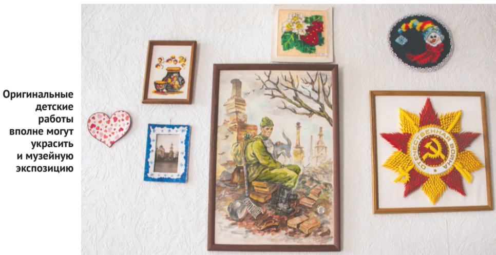
Оригинальные детские работы вполне могут украсить и музейную экспозицию

барсом сделала одна из выпускниц Дома творчества. Каждая такая работа требует аккуратности, усидчивости и, как минимум, полутора — двух месяцев творческого огонька.