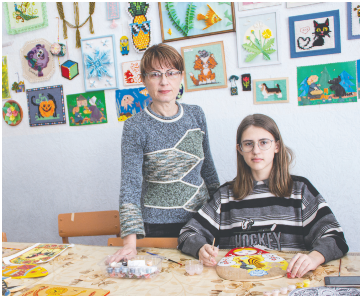
Рядом с талантливым учеником всегда стоит талантливый педагог