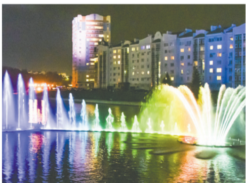
Вдохновение «Крыльев орла»

В Орле 1 мая прошла выставка-дегустация продукции местных производителей «Сделано в России. Выбираем орловское!»