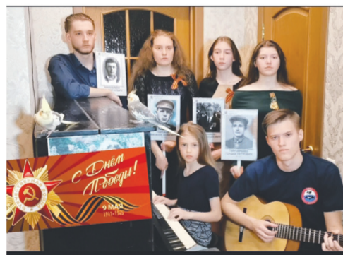
В свете любви и добра