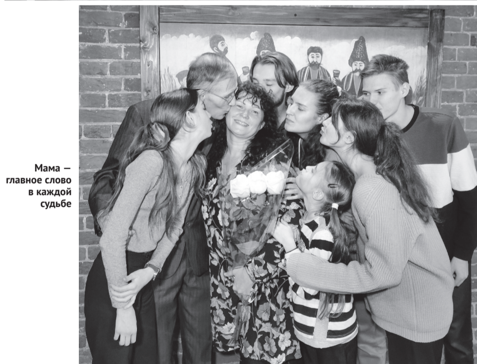
Мама — главное слово в каждой судьбе

Когда тебе дают в руки этот свёрток с маленьким существом, которое ещё никто не видел, а оно уже живёт в этом мире, чувства трудно описать словами!.. Это самые неповторимые и трогательные моменты в жизни, ради которых стоит жить... Когда я слышу про аборт, меня аж переворачивает: как можно убить своё дитя?! И никакие материальные трудности тут не могут служить оправданием: если Бог даёт ребёнка — он должен обязательно появиться на свет, ведь даже самая успешная карьера его не заменит.