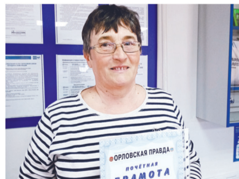
Почтальон в век эсэмэсок