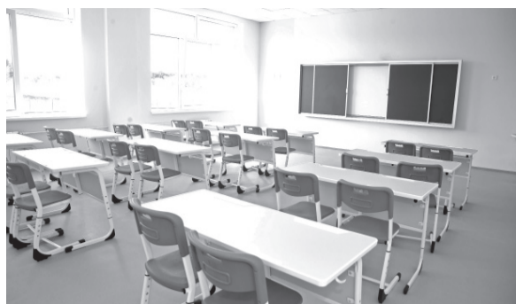
Новая школа в Орле готовится к приёму детей