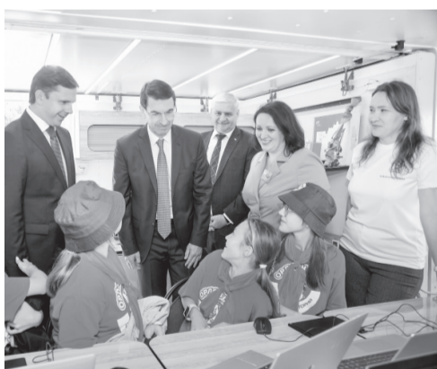
Всё лучшее — детям!

квантум», «Промробоквантум», «IT-квантум» и «Хайтек», каждое из которых способствует развитию творческого потенциала ребёнка вне зависимости от уровня его стартовой подготовки.