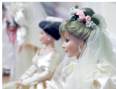
С этого дня и навек!.. Свадебное платье – словно нить, соединяющая разные поколения одной семьи