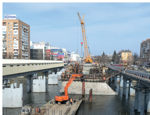
Красный мост: преимущественное финансирование