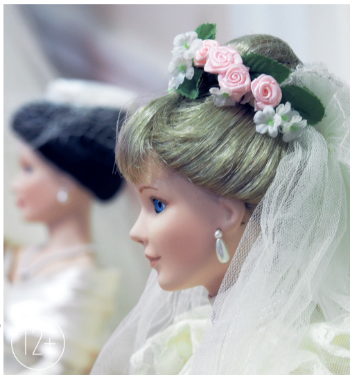
Куклы так похожи на невест!