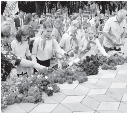
Орловцы принесли цветы, игрушки и свечи в память о погибших детях