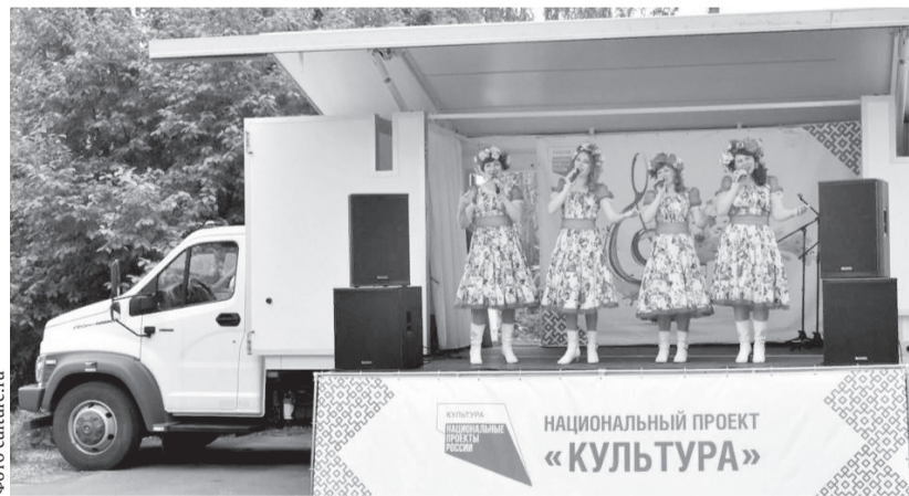
Сегодня культура в прямом смысле сама едет к людям благодаря передвижным многофункциональным центрам

Мероприятия, посвящённые этому событию, проходят в течение всего года. А кульминацией станут торжества, приуроченные ко Дню города Орла. Программа не ограничится одним днём и включит в себя более 120 мероприятий в разных районах: выставки, концерты, интерактивные программы,