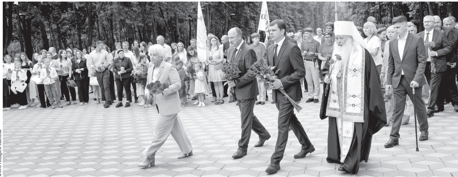
Орловщина помнит о невинных жертвах киевского режима

— К великому сожалению, киевский фашистский режим, подстёгиваемый Америкой и коллективным Западом, продолжает бомбить мирных