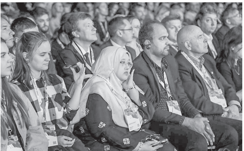
В Российско-малайзийском научном дне принимали участие ведущие научные организации двух стран