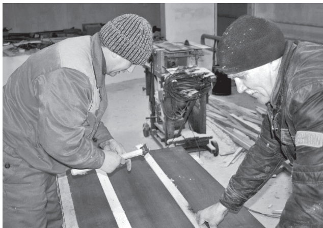
Оплачиваемые общественные работы — своеобразная палочка-выручалочка. Они помогают пережить наиболее трудное время, обеспечивая пусть

В регионе с начала 2023 года в оплачиваемых общественных работах приняли участие 200 безработных.